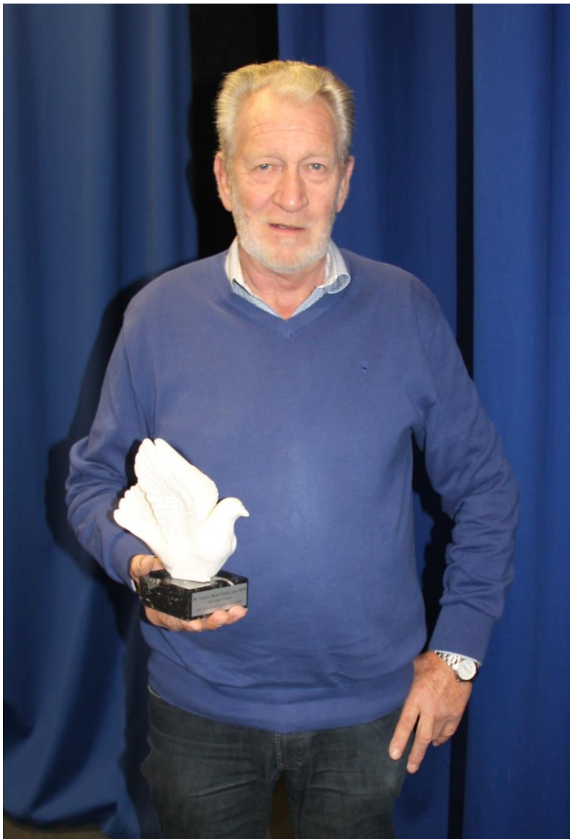
Overzicht Quiévrain Zondag 28 juni 2020.